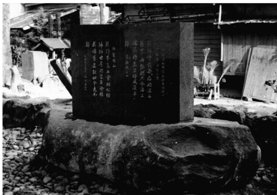
1966年落成的新宫绝海·太祖诗碑

这是最具影响的一次中日徐福文化交流。明太祖为一国帝王,召见日本僧人时,竟询问徐福庙之事,可见当时徐福东渡影响之大及明太祖对1500多年前徐福出使日本的关注了。