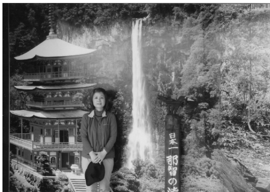
1969年落成的那智徐福庙