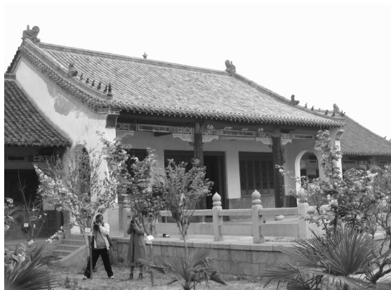
1988 年落成的赣榆徐福村徐福祠正殿