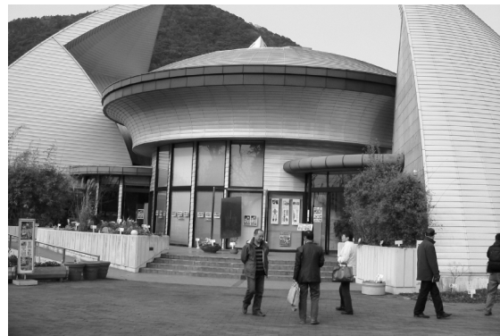
1995 年落成的佐贺徐福长寿馆

三是，徐福国际学术研讨和纪念活动普遍展开。1986 年，赣榆县举行江苏省首届徐福学术研讨会，开启了中国徐福学术专题会议的先声。赣榆、连云港、龙口、胶南、沧州、盐山、秦皇岛、慈溪、岱山、苏州、象山和中国徐福会等徐福社团，先后多次举行各种类型的徐福研讨会。自佐贺县于 1989 年举行徐福国际研讨会后，日本国新宫、串木野、八女、堺市、富士吉田、八丈岛、小泊和日本徐福会以及韩国济州、西归浦、南海、巨济、昌原、咸阳等地先后举办徐福国际研讨会、报告会。中国赣榆、龙口、岱山等地还先后多次举办徐福节庆活动。至此，东亚地区集体研究、纪念徐福的气氛日益浓郁，徐福文化交流达到高潮。