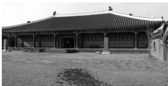
2003 年落成的西归浦徐福展示馆