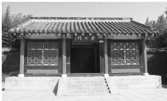
1998 年落成的龙口徐公祠